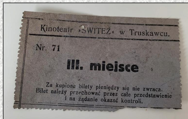
Wykorzystany (bez kuponu kontrolnego) bilet do kinoteatru „Świtez”

Jak w owym czasie wyglądały bilety do kina? Nie różniły się specjalnie od współczesnych. Przykładowy bilet przedstawia poniższa fotografia.