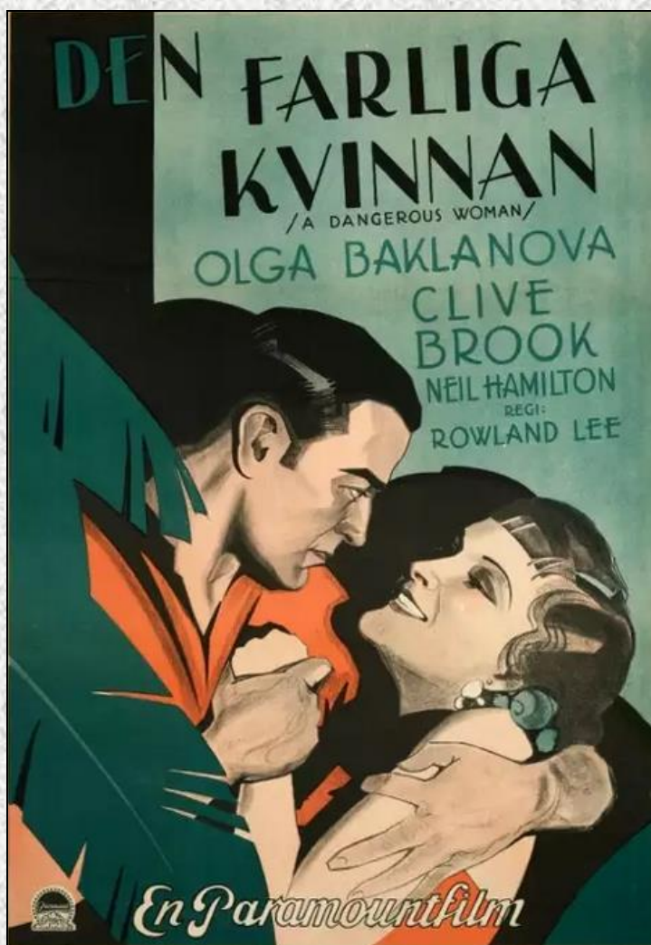
Plakat filmowy (szwedzki)