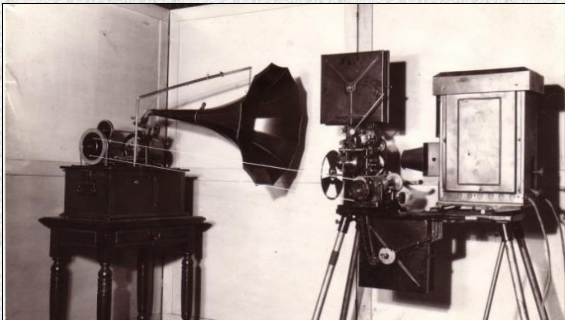
Demonstracja pierwszego "mówiącego kina" przy użyciu kinetofonu - cylindrycznego odtwarzacza mechanicznie zsynchronizowanego z projektorem filmowym

Przykład synchronizacji dźwięków z obrazem w filmie przedstawia poniższa fotografia.